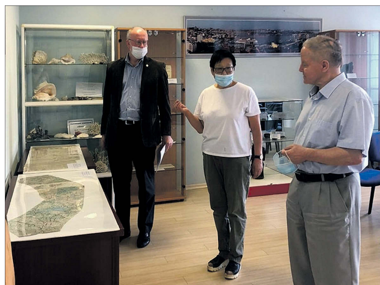
Экспозиция размещена в малом конференц-зале ТОИ ДВО РАН

В феврале 1943 года И.И. Берсенева получил осколочное ранение в руку (огромный шрам от вырванной части мышцы был замечен до конца жизни). В июле 1943-го контужен от близкого разрыва